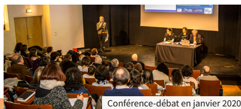
Conférence-débat en janvier 2020