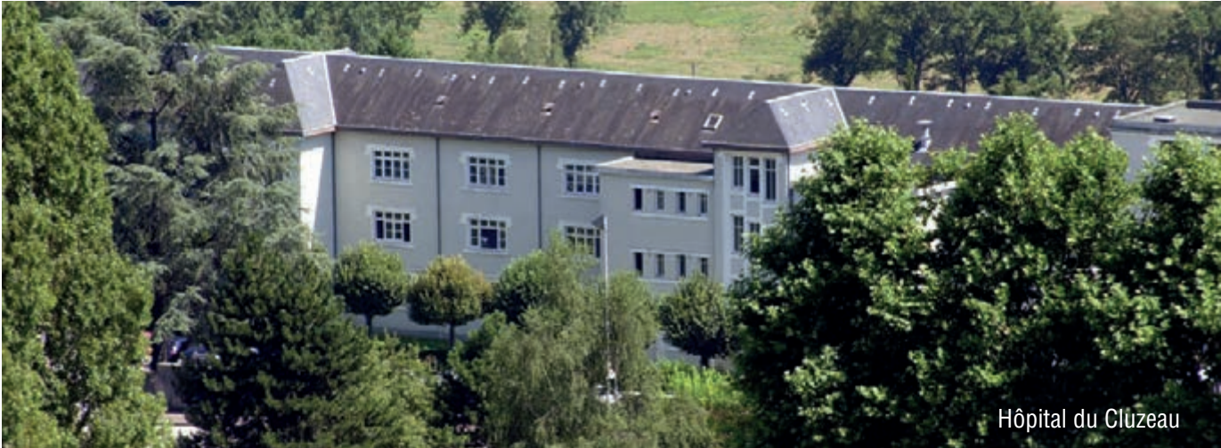
Hôpital du Cluzeau